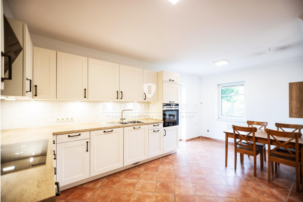
Küche EG / Wohnbereich 1