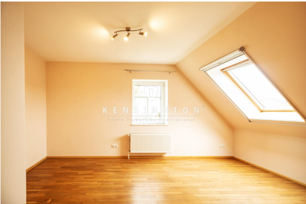
Schlafen OG / Wohnbereich 1