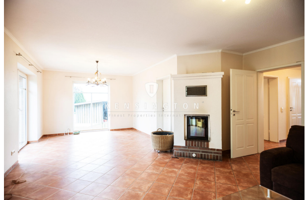
Wohnen EG / Wohnbereich 1