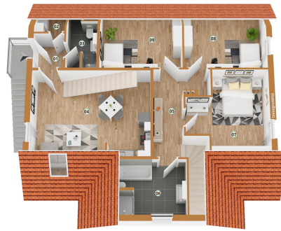
Grundriss OG + Wohnbereich 2