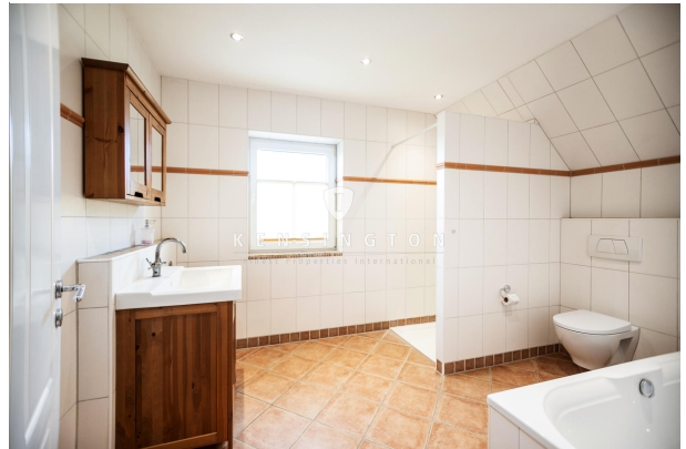
Bad OG / Wohnbereich 1