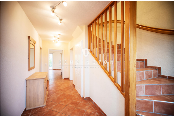
Flur EG / Wohnbereich 1