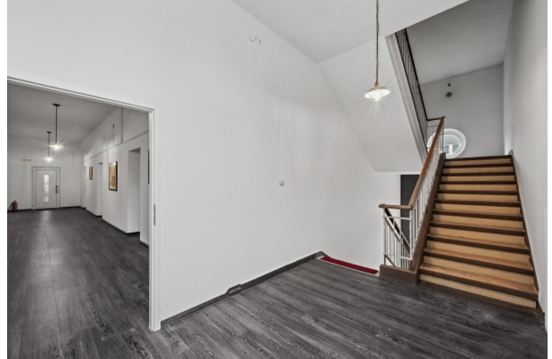
Treppenaufgang im 1. OG