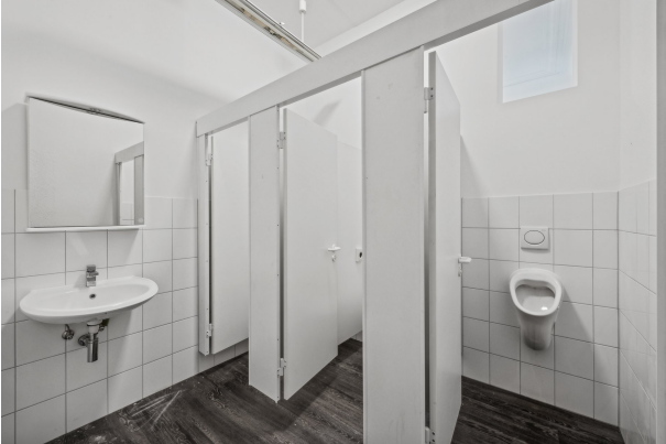
Herren-WC im 1. OG